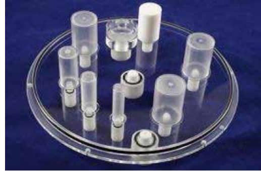
Flangeless Esser PET Phantom Lid™

NOTE: Above Lid can be made for Flanged or Flangeless Cylinder, call for details