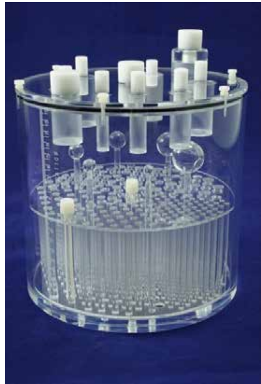
Flangeless Esser PET Phantom™